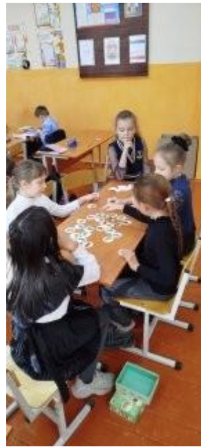
Пятница 15.11.2024г. Выставка рисунков: «Денежные купюры».